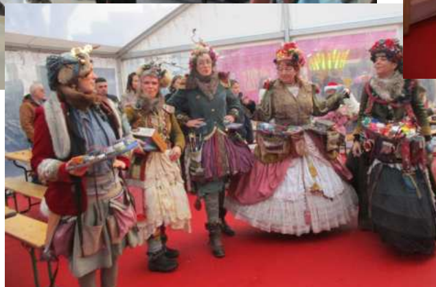
Marché de Noël de l'EHPAD Arc-en-Sée Avranches