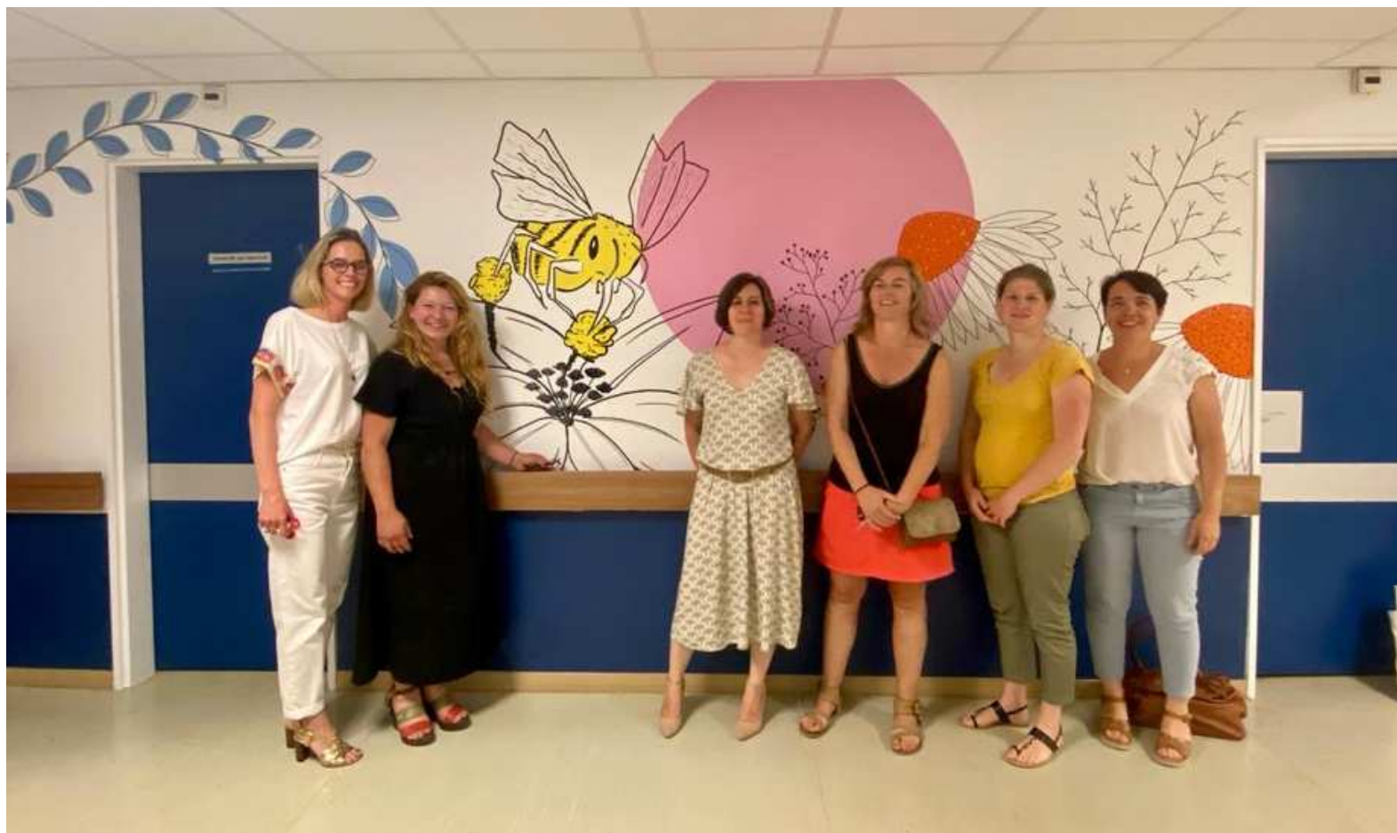
Inauguration de la fresque artistique CH Granville