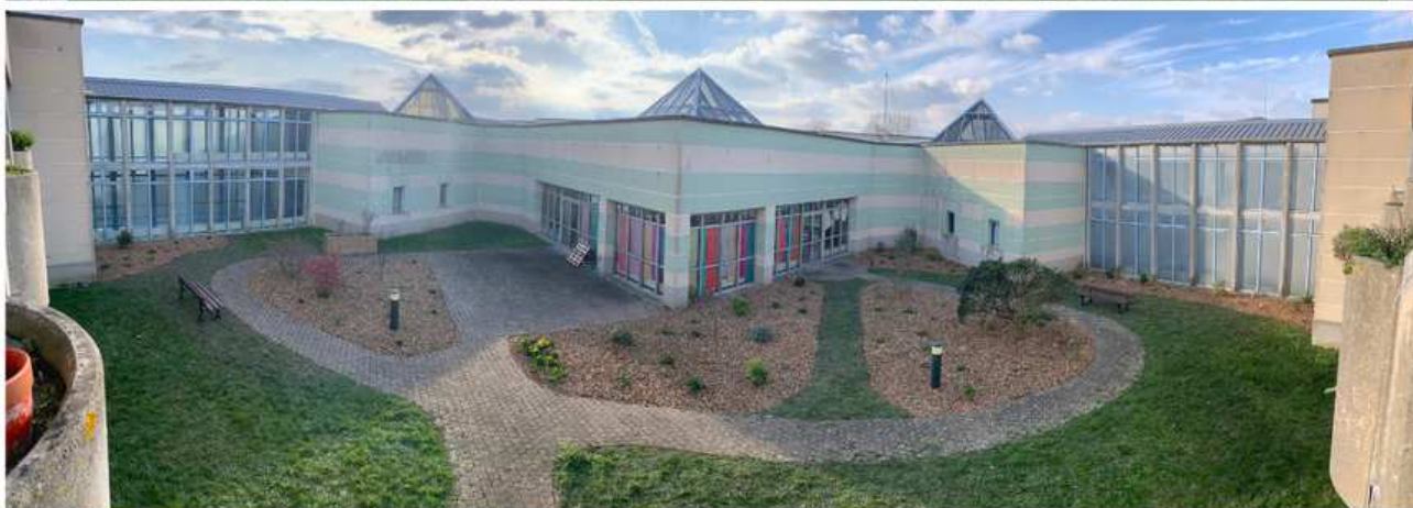
Rénovation du jardin de la résidence EHPAD Paul Poirier de Granville