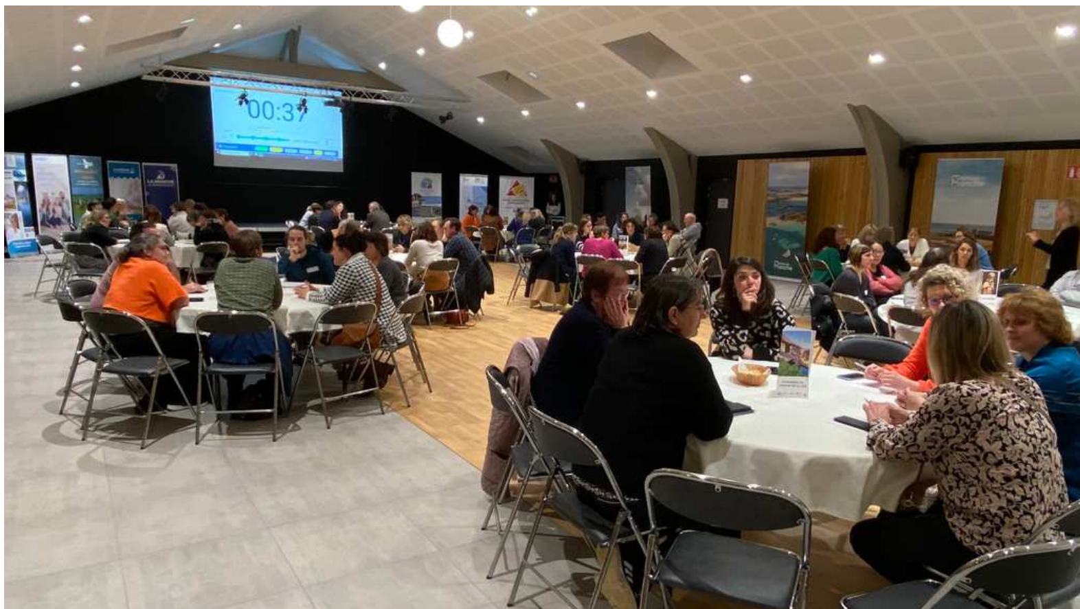
1er speedmeeting des professionnels de la santé Avranches