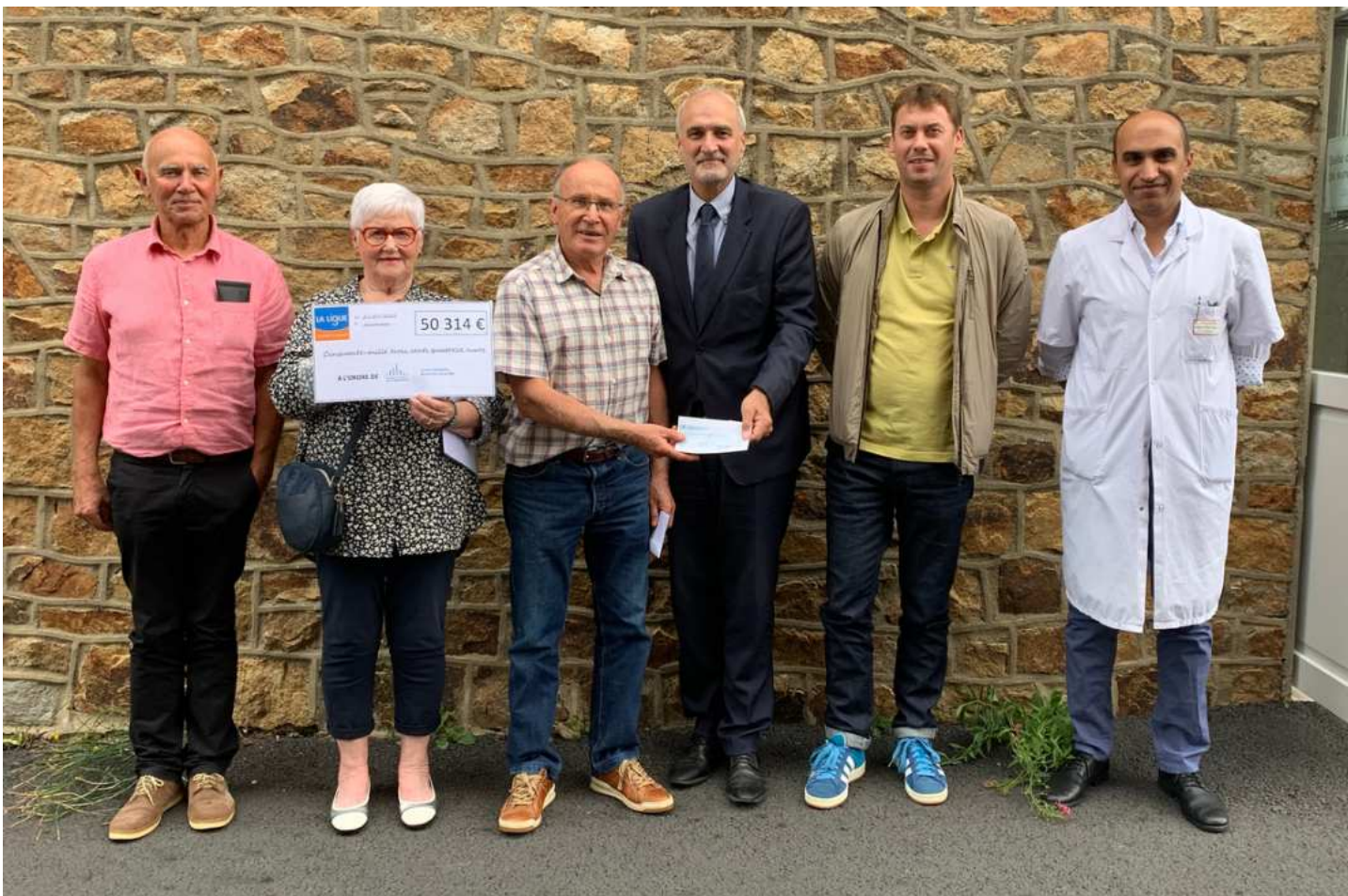
Remise du chèque de la Ligue contre le cancer CH Avranches