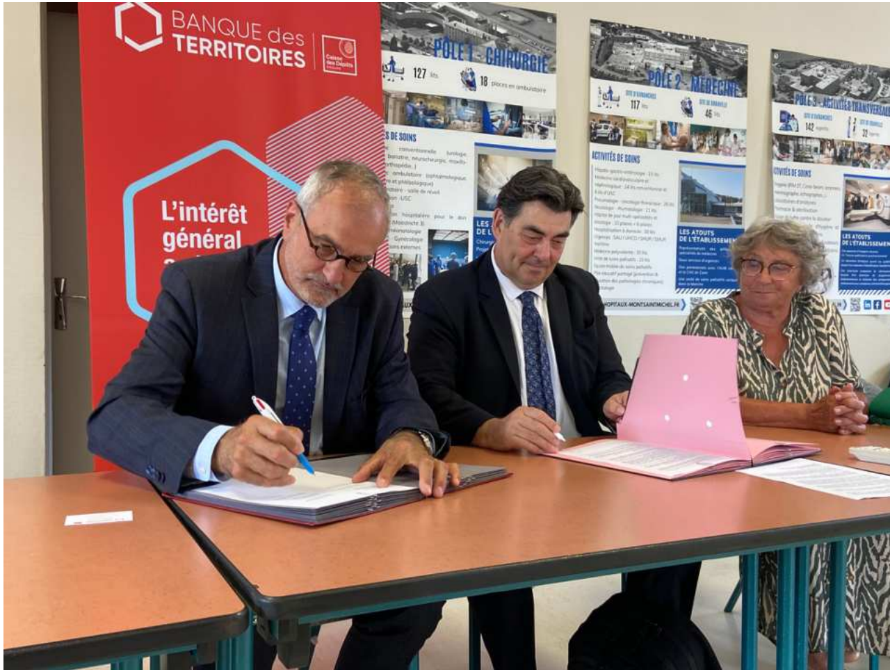
Signature du partenariat avec la banque des territoires CH Avranches