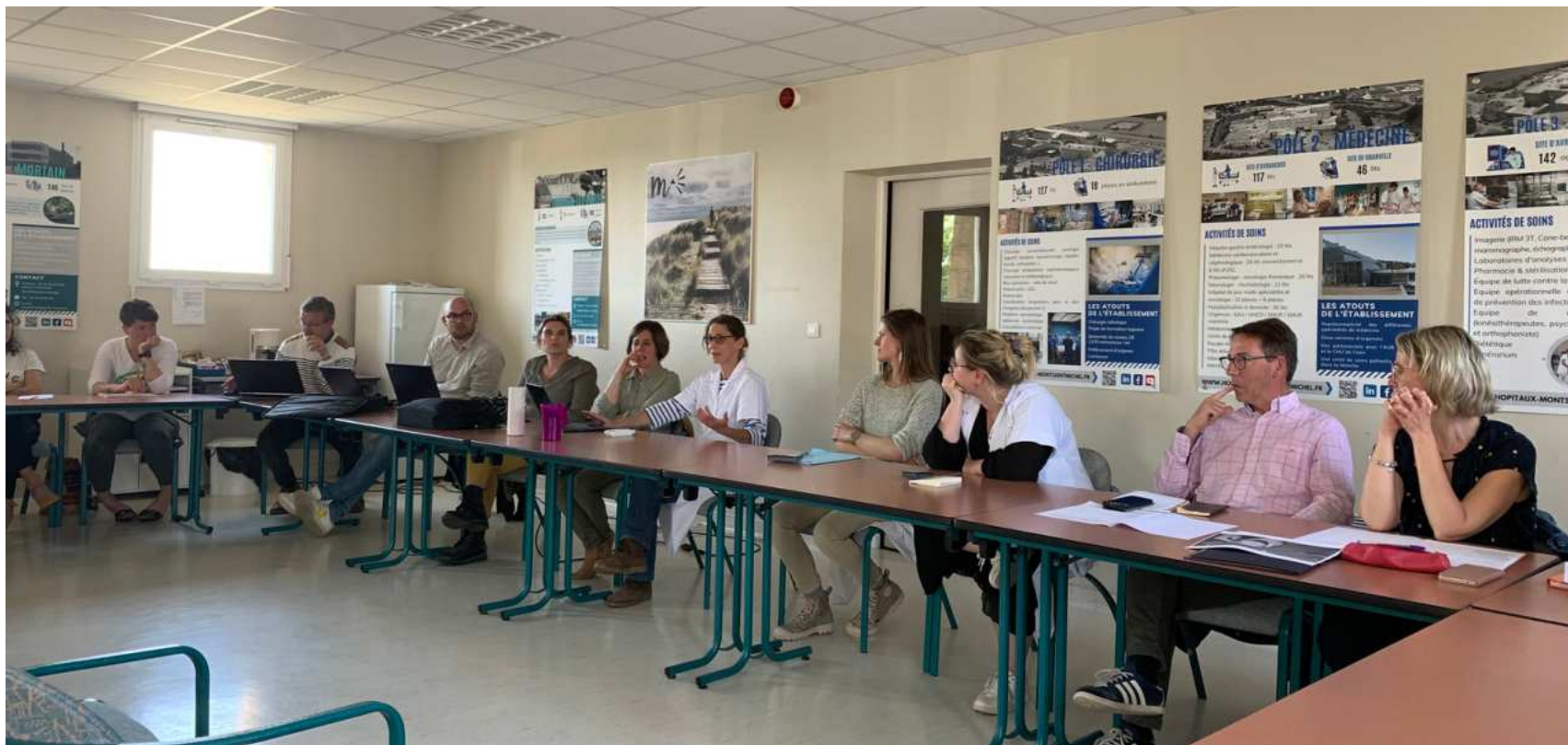
Réunion du bureau Empreinte, démarche durable CH Avranches