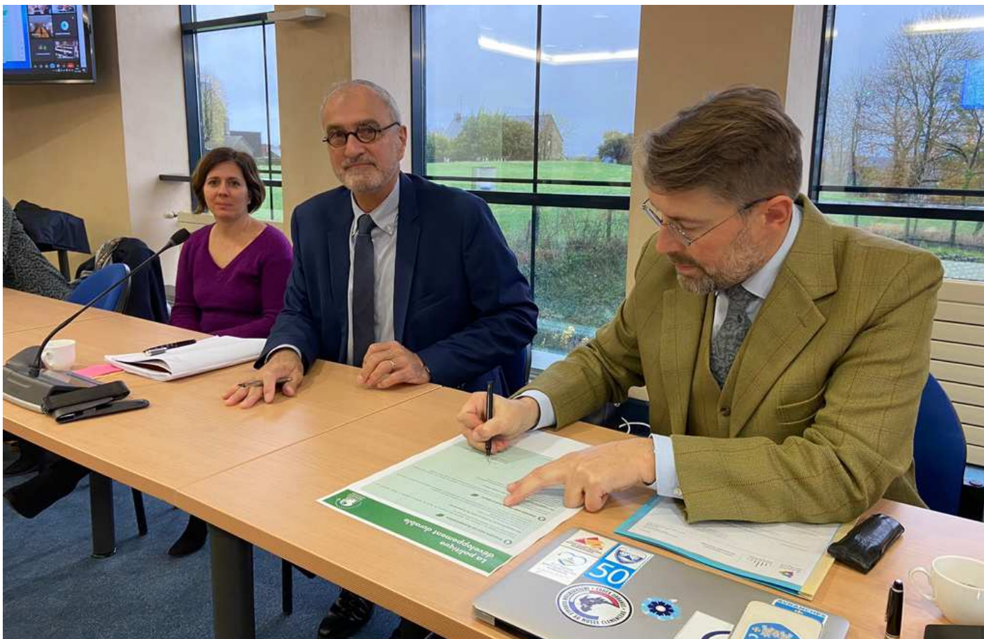
Signature de la charte Développement durable en CTCL Avranches