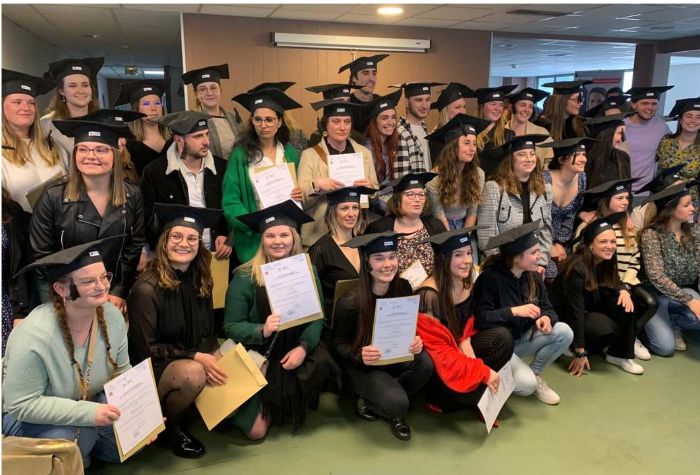
Remise des diplômes IFSI de Granville