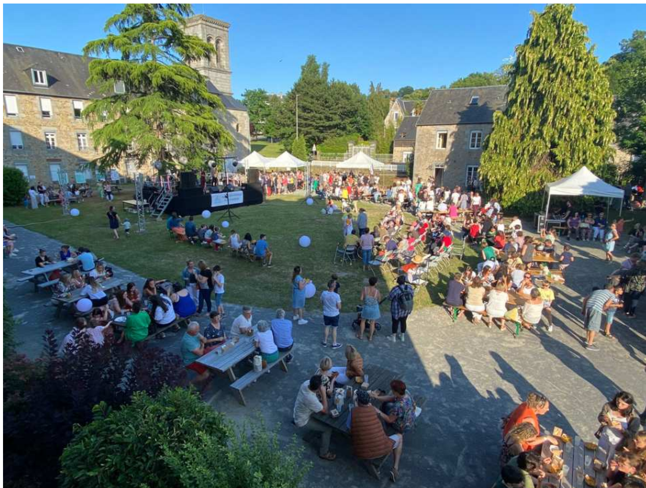
3e Fête des hôpitaux du Sud-Manche CH Avranches