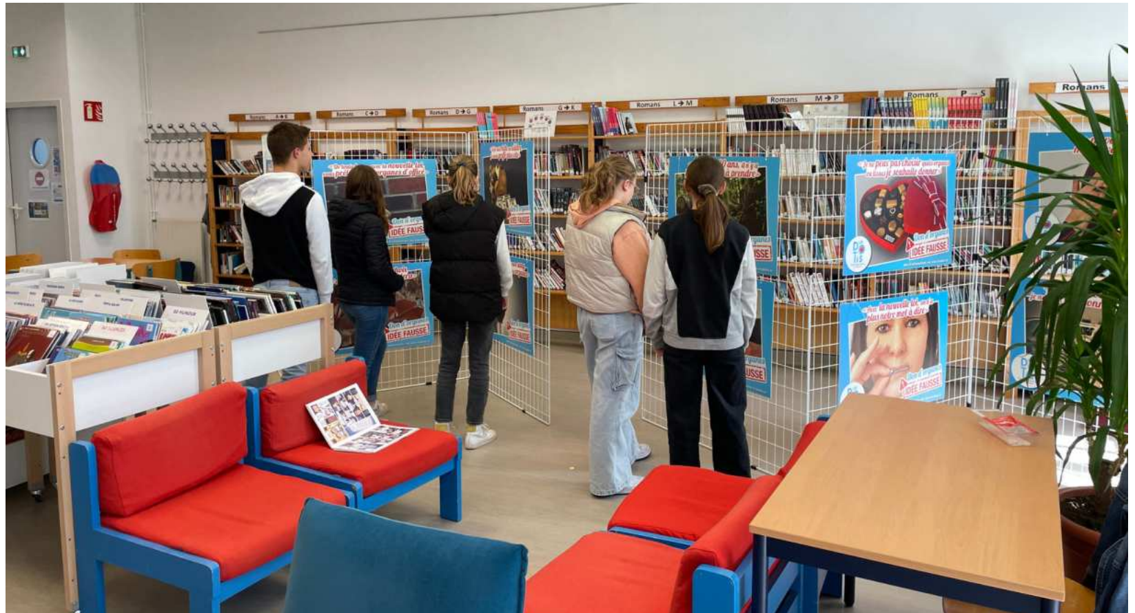
Sensibilisation des lycéens au don d'organes Avranches