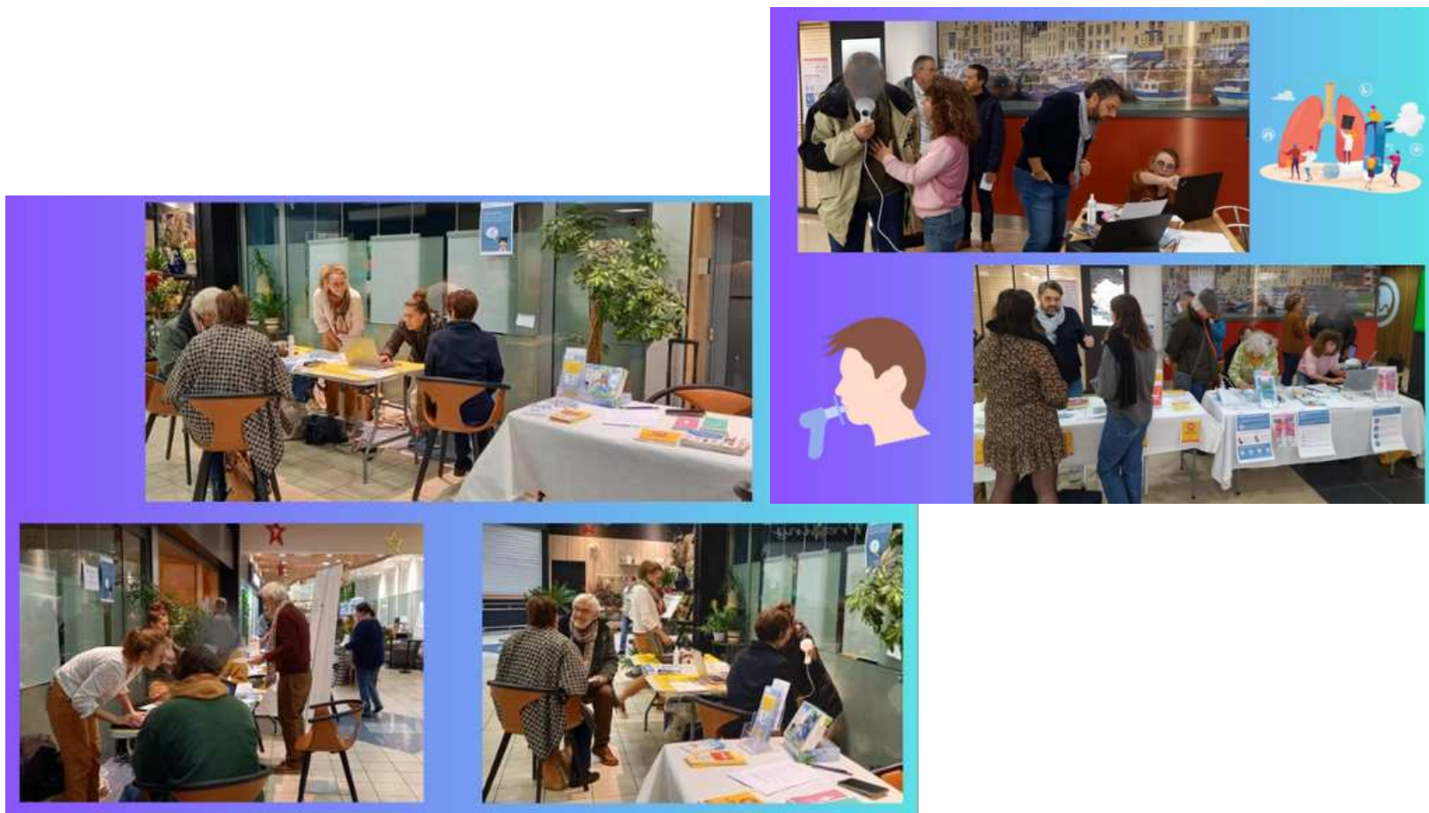
Journée de prévention et dépistage de la BPCO CH Avranches-Granville