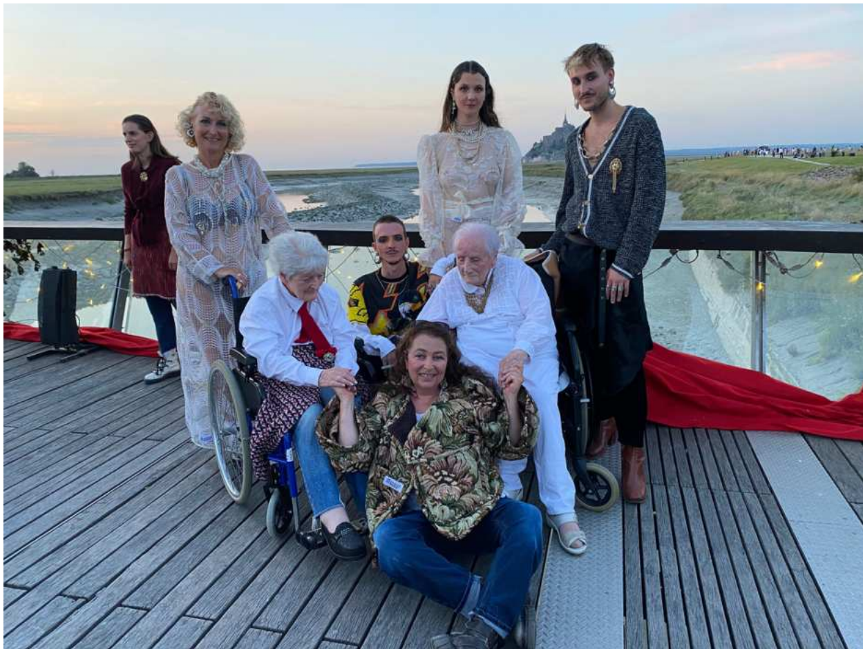
Défilé de mode des résidents de l'EHPAD de Villedieu Le Mont-Saint-Michel