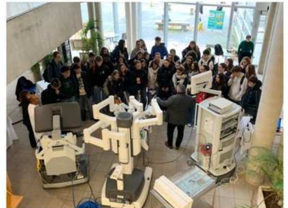
Journée de prévention des cancers masculins Movember CH Avranches