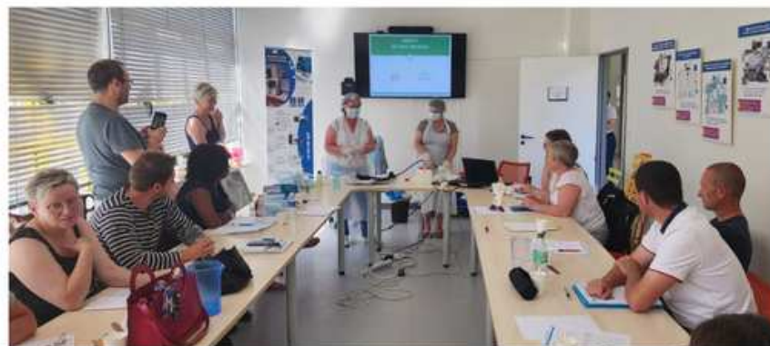
Formation inter-GHT en endoscopie par l'équipe SEPCI Saint-Lô