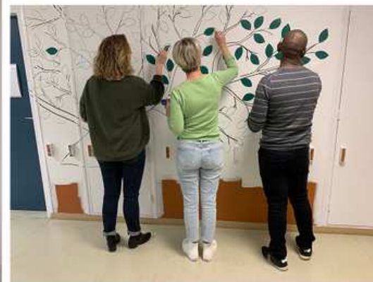
Conception & réalisation d'une fresque artistique CH Granville