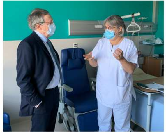
Unité de soins palliatifs Visite de Monsieur le sénateur