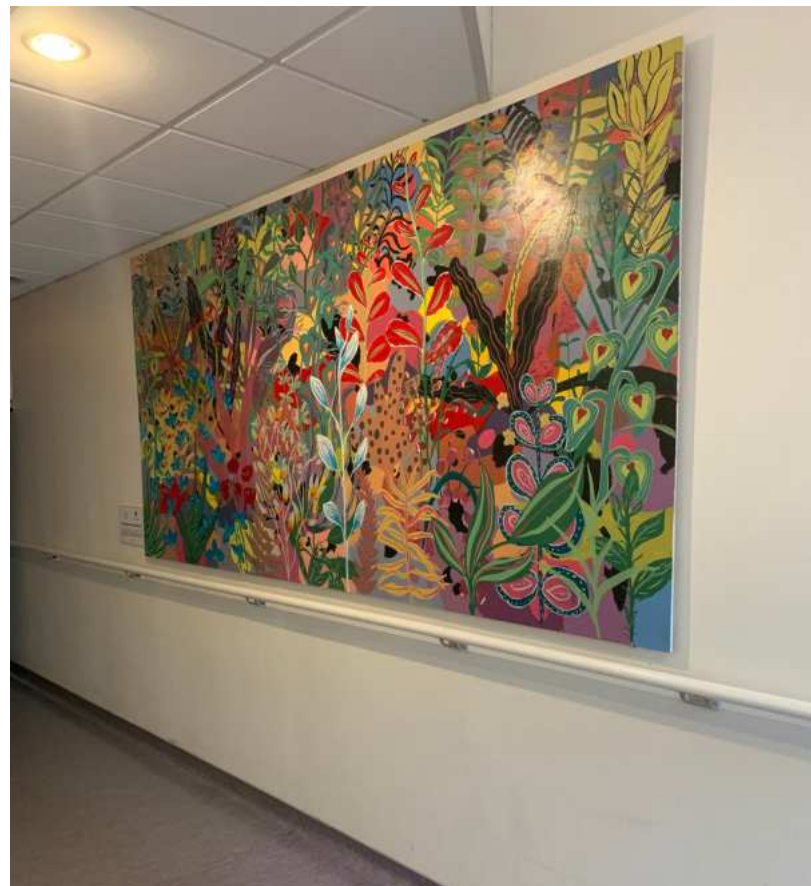
Exposition sur le don d'organes CH Avranches