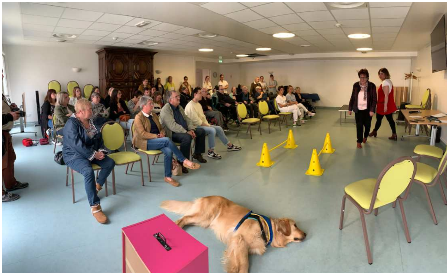
Présentation du dispositif Handi'Chiens EHPAD Paul Poirier de Granville