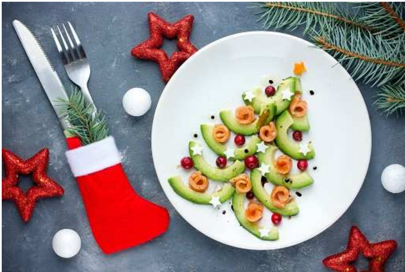
Repas de Noël du personnel CH Avranches-Granville