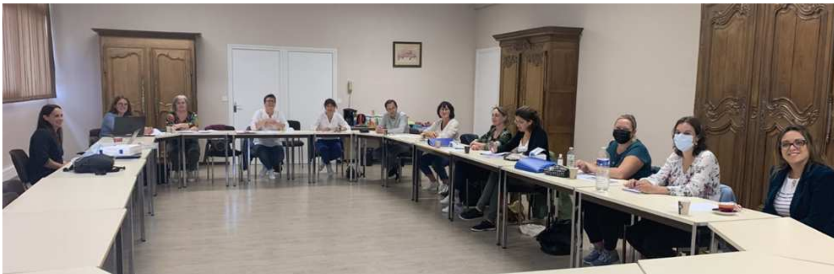
Réunion Inter-CLUD CH Hilaire-du-Harcouët