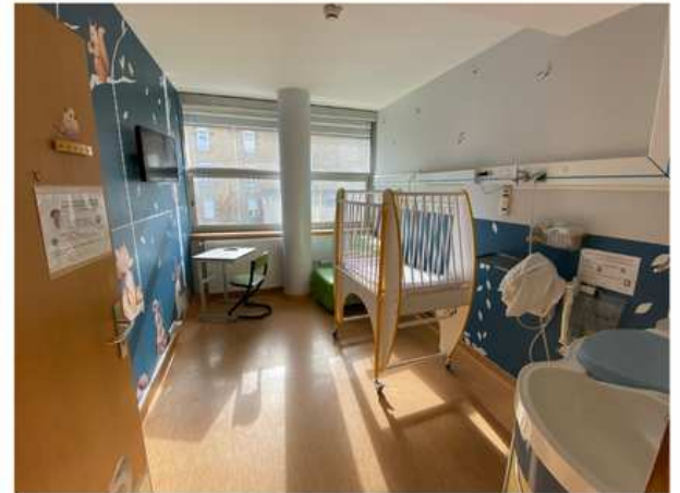
Chambres de pédiatrie Nouvelle décoration