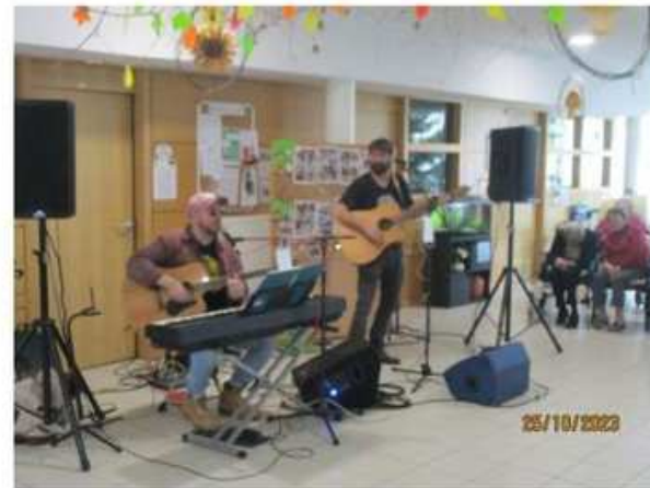
Buffet campagnard EHPAD Arc-en-Sée d'Avranches