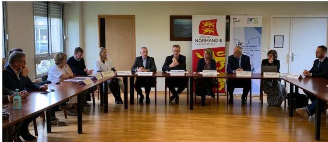
Inauguration des nouveaux services d'UCC et CSG CH Granville