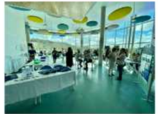
Jobdating groupe hospitalier Mont-Saint-Michel #3 Avranches