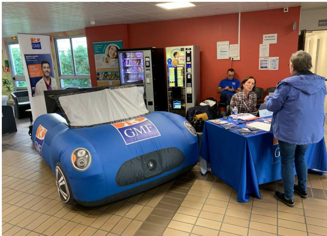
Journée de prévention routière CH Granville