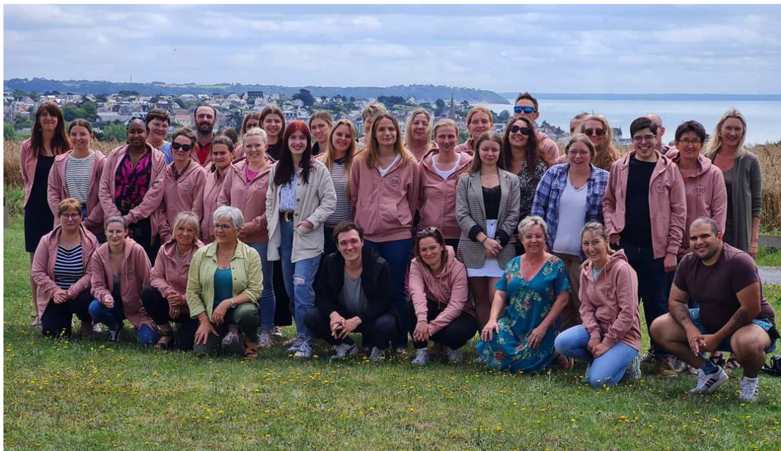
Remise des diplômes IFAS Granville