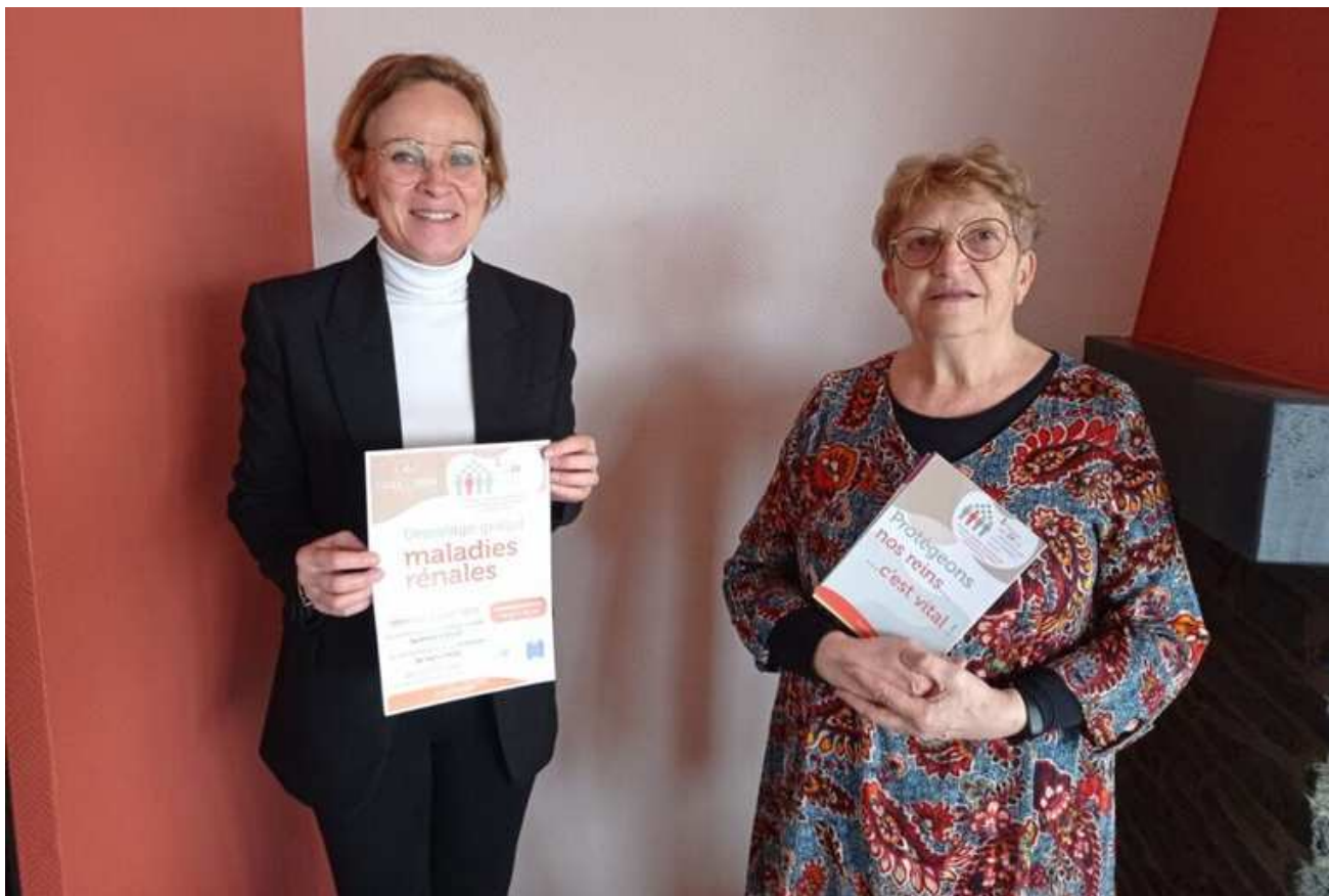
Journée de dépistage des maladies rénales CH de Mortain et Saint-Hilaire