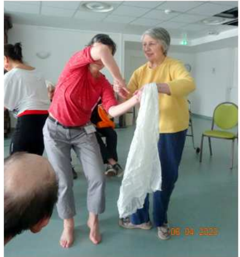
Atelier expression corporelle EHPAD Paul Poirier de Granville