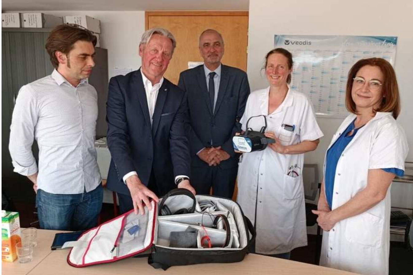
Remise de casques de réalité virtuelle par le Rotary Club CH Granville