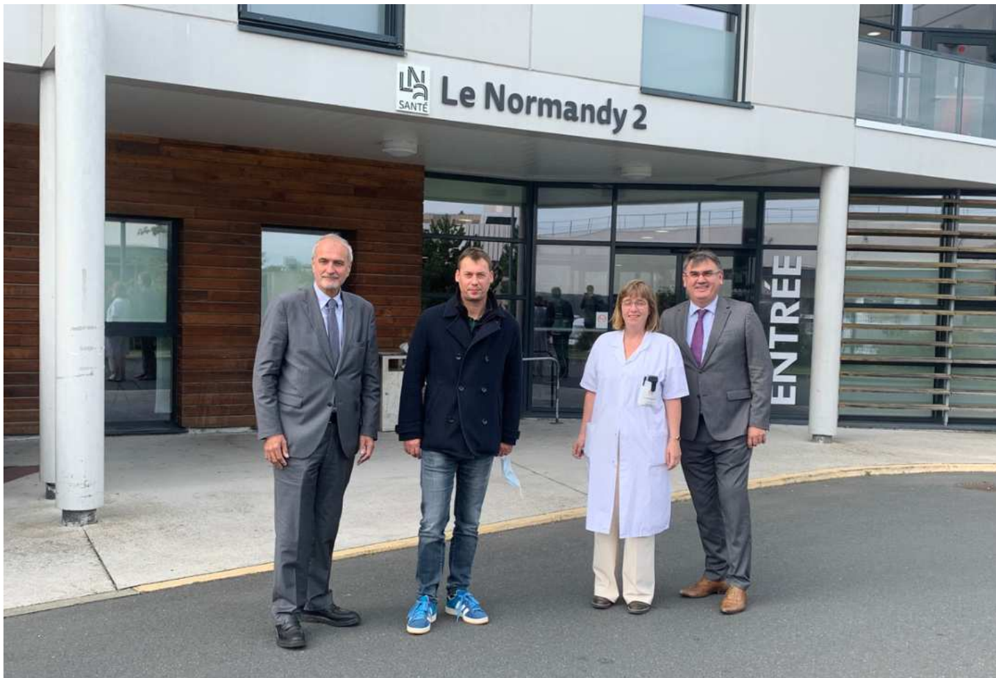
Conférence de presse conjointe CHAG - Le Normandy Granville