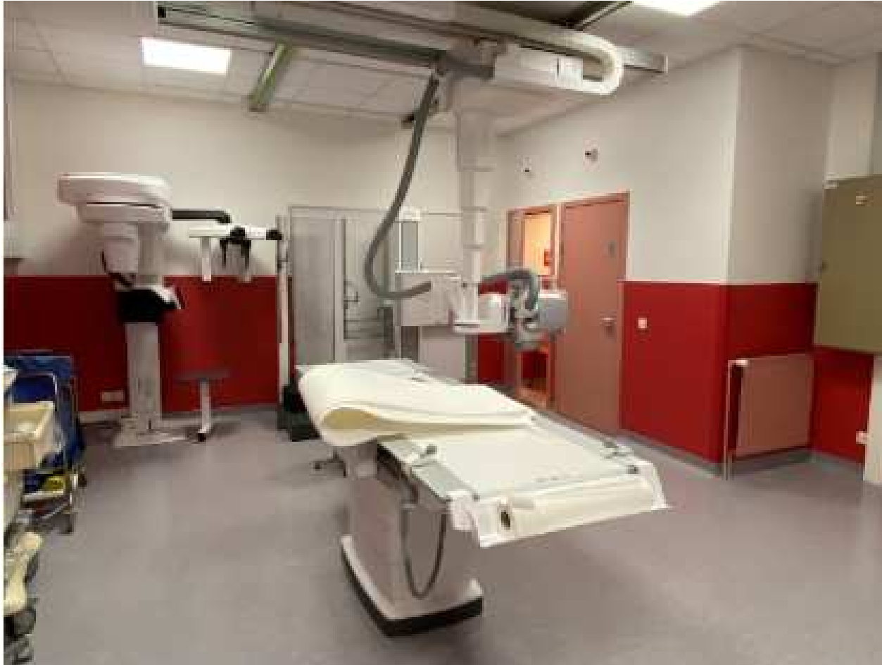
Modernisation du service d'imagerie avec l'IA CH Avranches