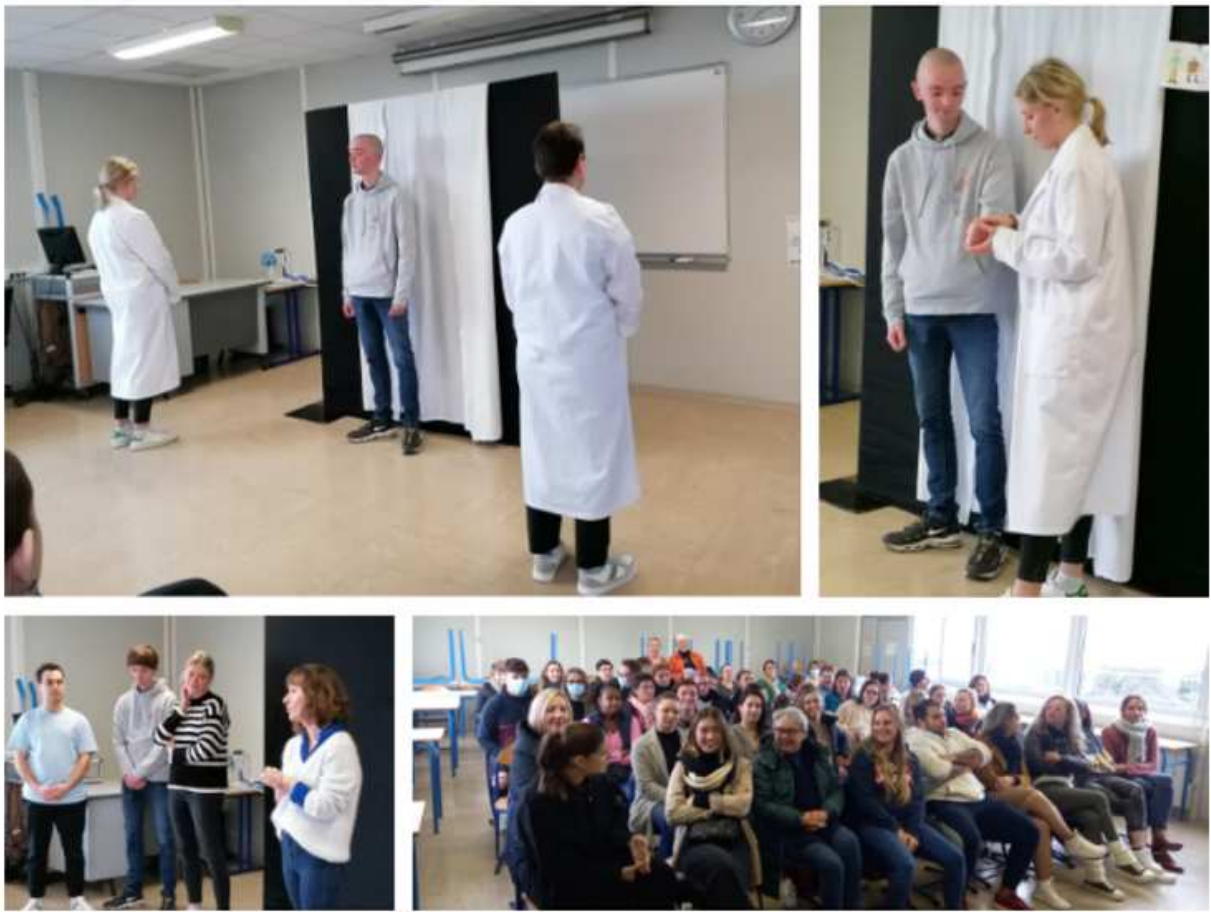
Théâtre à l'IFAS Accompagnement au cancer