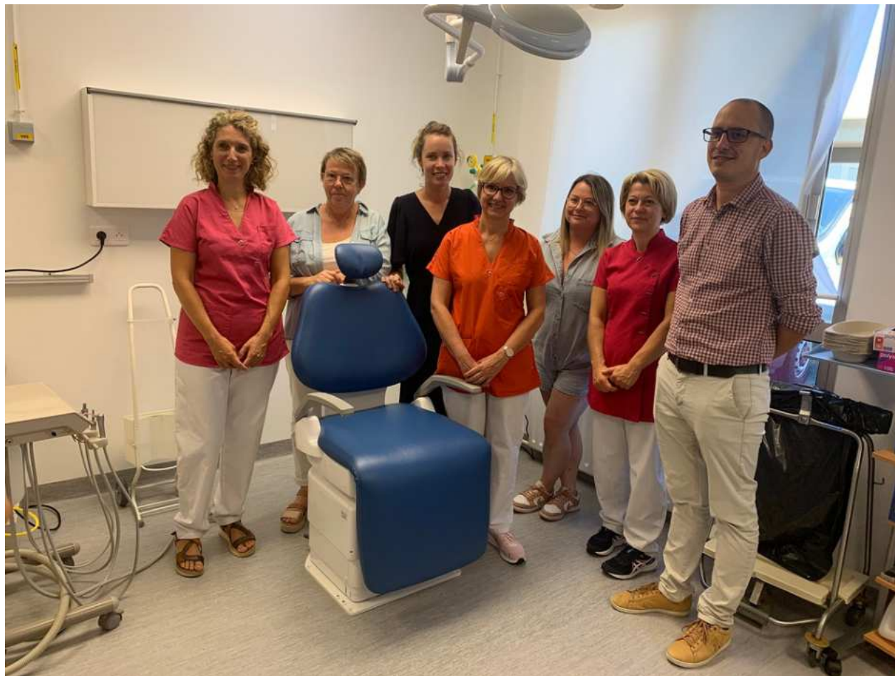
Inauguration des consultations dentaires Handi'Consult CH Granville