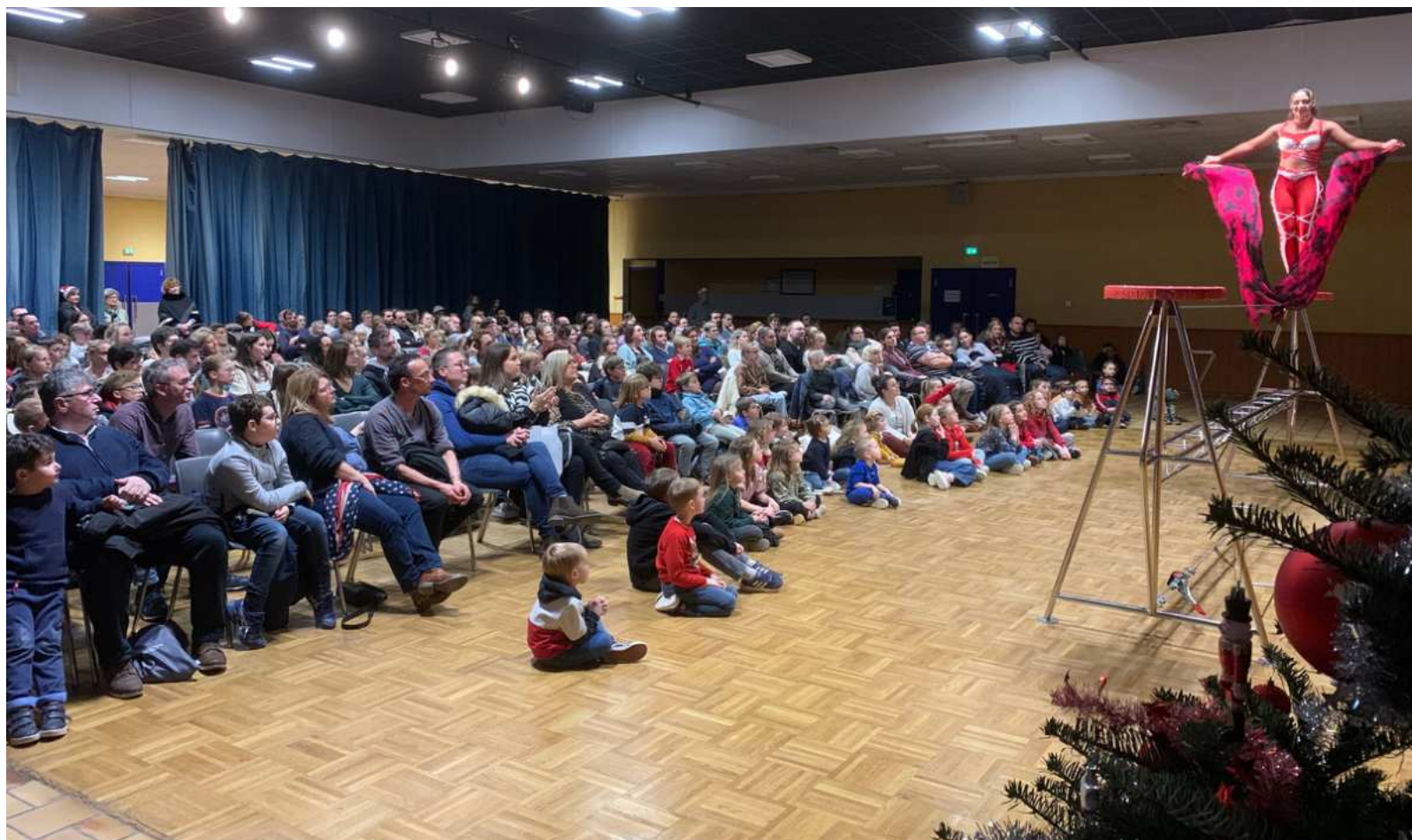
Spectacle de l'Arbre de Noël du personnel Avranches