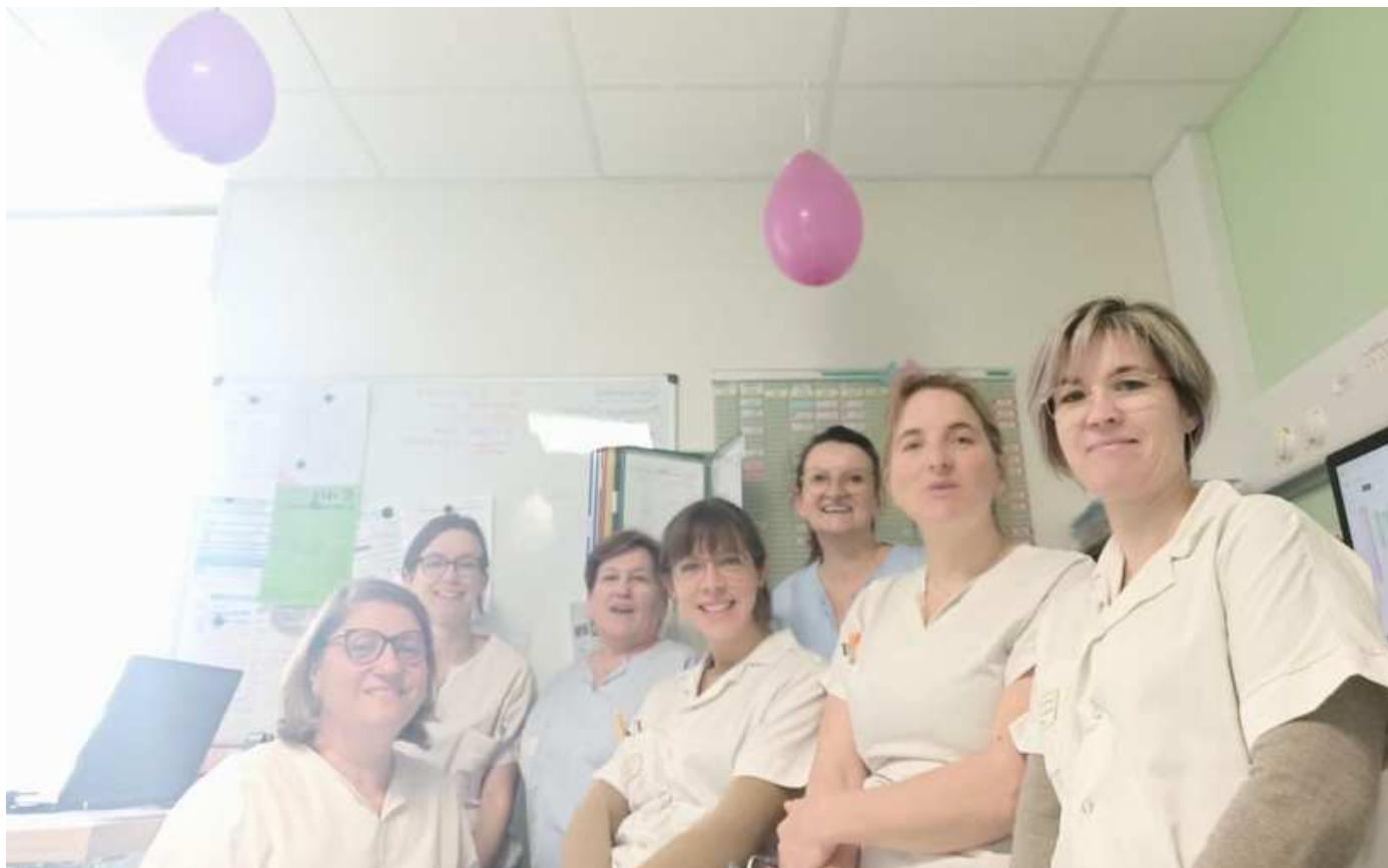
Anniversaire d'ouverture de l'HDJ CH Avranches